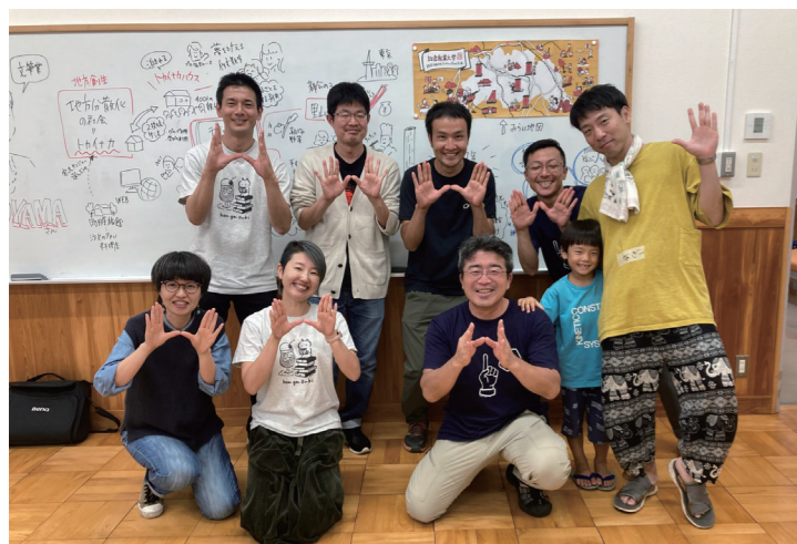
左: 途中退席、オンライン参加の方もいたので数が減ってしまいましたが、最後にみんなで撮った集合写真。HIKIポーズ。右: 託児をする、22春生のなごーら。お母さんも安心して参加できました。